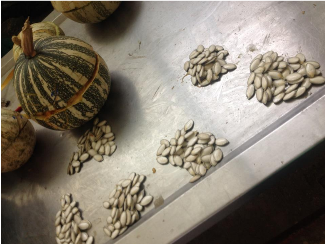
Figura 7. Conteo de las semillas

La “guatemalteca” este genotipo tiene un promedio de diámetro polar 17.10 cm y de diámetro ecuatorial de 19 cm, con un color de pulpa anaranjado, con un promedio de 300 semillas, a la vez su semillas tienen un largo de 2.44 cm y el ancho de 1.24 cm y un grosor de semilla 0.41cm. (Figura 7).