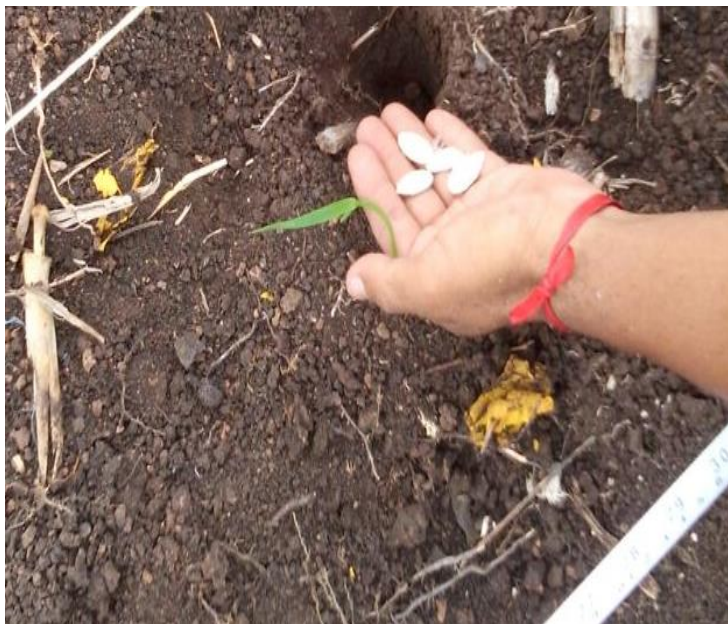
Figura 4. Siembra de las semillas de calabaza

Se sembró el 17 mayo con vísperas de las primeras lluvias de mayo-junio, y se procedió a depositar 4 semillas por poceta, con una profundidad de 5 cm, teniendo un promedio de 67 surcos y 100 plantas en por surco con un total de 6700 plantas. (Figura 4).