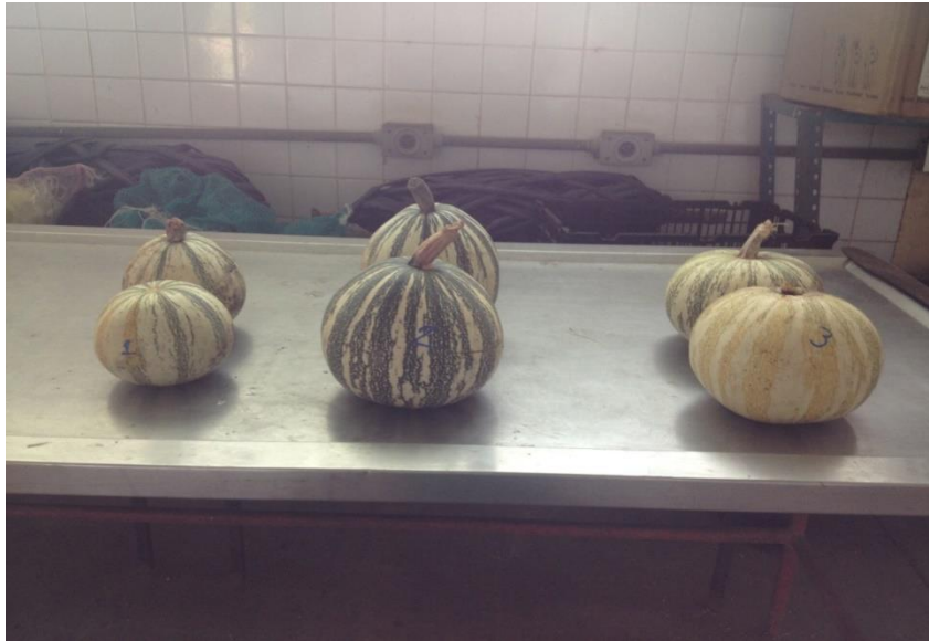
Figura 5. Los tres tipos de calabaza

En este trabajo se encontraron tres genotipos conocidos como “chihua”, “guatemalteca” y el “pipián (Figura 5).