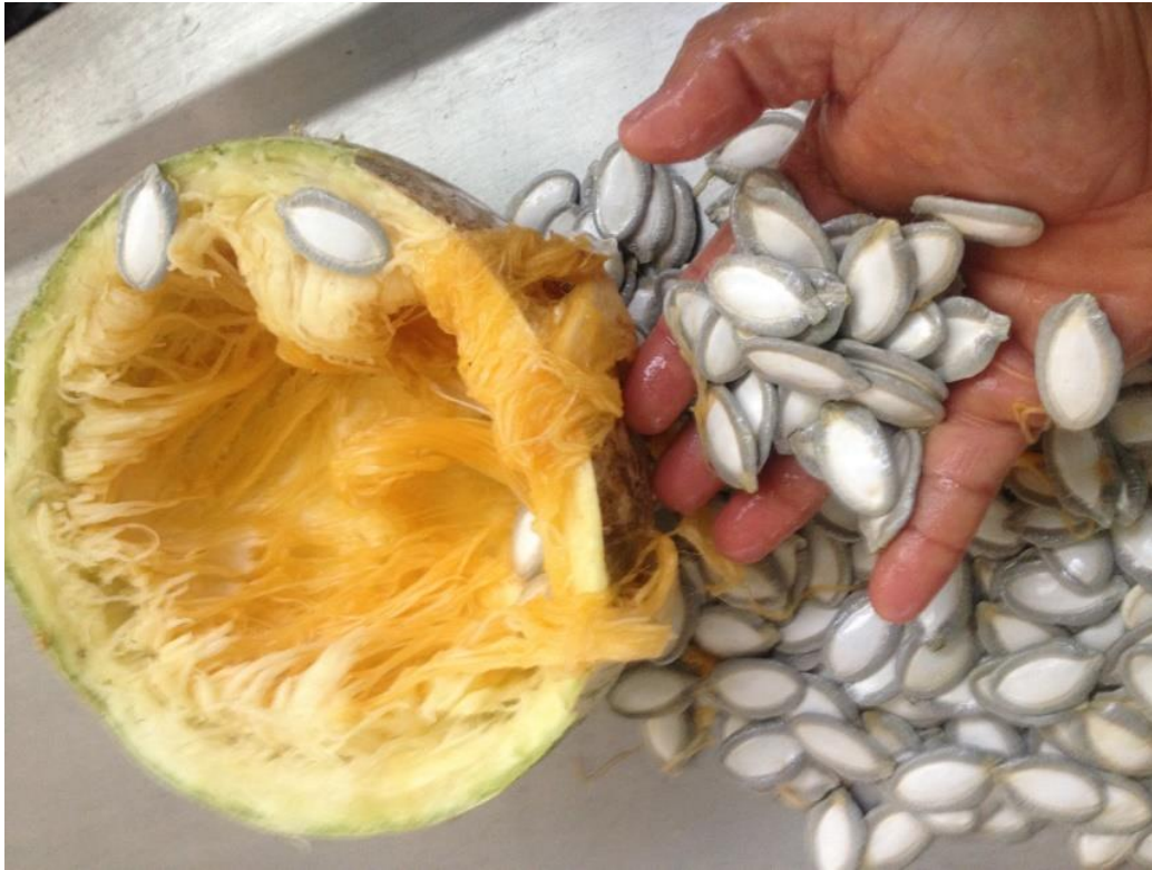
Figura 8. Identificación de color de la pulpa

El “pipián ” este genotipo tiene un promedio de diámetro polar 13.5 cm y de diámetro ecuatorial de 19 .25cm, con un color de pulpa anaranjado pálido , con un promedio de 130 semillas, a la vez su semillas tienen un largo de 3.01 cm y el ancho 1.72 cm y un grosor de semilla 0.36 cm.(Figura 8).