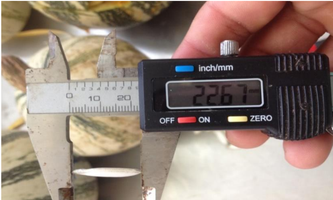
Figura 6. Medición del largo de la semilla

La “Chihua” se encontró tiene un promedio de diámetro polar 12.65 cm y de diámetro ecuatorial de 15 cm, con un color de pulpa cremoso, con un promedio de 250 semillas, a la vez su semillas tienen un largo de 2.34 cm y el ancho 0.87 cm y un grosor de semillas de 0.33 cm. (Figura 6).