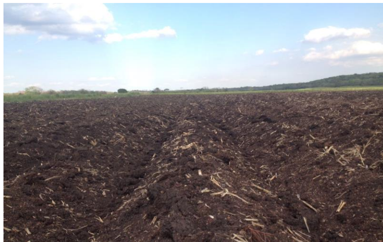
Figura 3. Encamado listo para sembrar

Para la primera condición de cultivo, se realizó un primer rastreo, después se dejó reposar por 2 meses, se volvió a dar el otro pase de rastra con la finalidad eliminar malezas que pudieran competir con la planta y afectar su desarrollo, y por último se surco la parcela con una distancia entre 1.5 m entre surco y surco con una profundidad de 0.50 m, con un tractor, en una superficie de 1 ha (Figura 3).