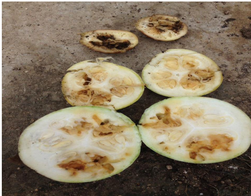
Figura 9. Daños de gusano barrenador

Unos de los principales problemas fue el del gusano de barrenador de la calabaza Gusano barrenador Diaphania nitidalis S.