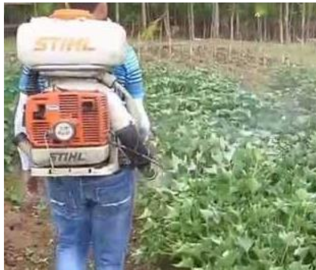
Figura 1. Aspersoras de motor.

6.3 La situación actual del equipo agrícola otorgado se podría considerar que falta mayor concientización en el cuidado de sus equipos, ya que se encuentran a la intemperie, situación que los afecta seriamente como lo es la oxidación de las mismas y acortando la vida útil del equipo e implementos.