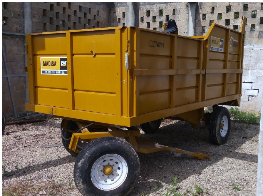
Figura 5. Remolque forrajero bajo protección.