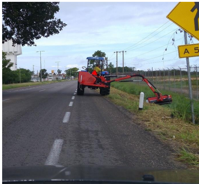
Figura 3. Chapeadora laborando.