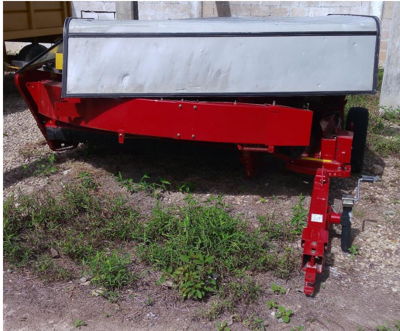
Figura 6. Desvaradora en buenas condiciones.