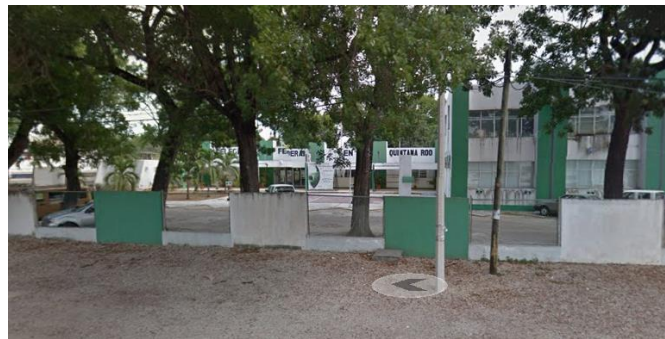
Figura 1. Delegación SAGARPA

El presente trabajo de investigación se llevó a cabo en la secretaria de agricultura, ganadería, desarrollo rural, pesca y alimentación (Figura 1). La secretaria se encuentra en el km.3.5 carretera Chetumal-Bacalar, viveros los mangos del municipio Othón P. Blanco en el estado de Quintana Roo, siendo una dependencia del poder ejecutivo federal que incentiva el aprovechamiento y uso sustentable de los recursos, e incentivar al desarrollo de las regiones agropecuarias mediante programas de apoyo para el fortalecimiento de la productividad y competitividad de los productos que se producen.