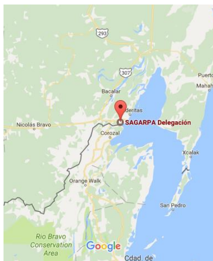
Figura 2. Ubicación de la SAGARPA en Quintana Roo.