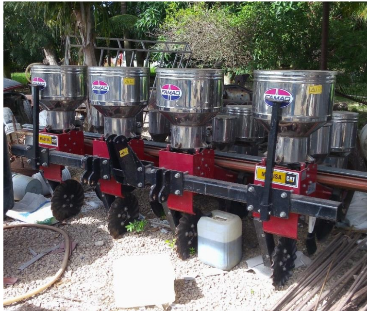
Figura 7. Sembradora en resguardo adecuado.