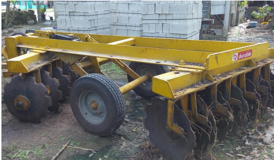
Figura 4. Rastra bajo condiciones climáticas.