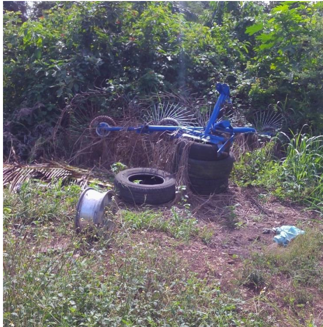
Figura 2. Rastrillo a la interperie.