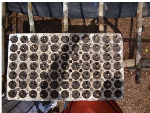
Fig. 6: Establecimiento del ensayo