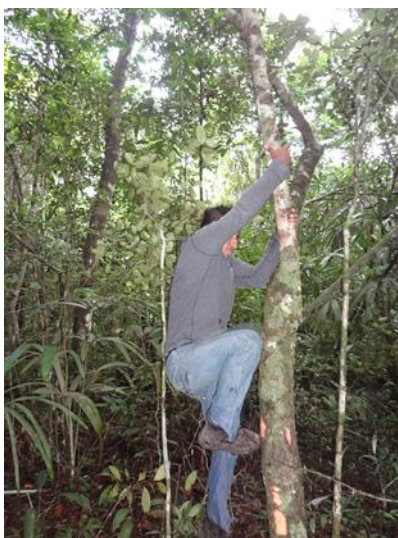
Fig.2: Colecta de varetas

4.2.2 Colecta de estacas. Una vez que se seleccionaron las zonas meristemáticas o zonas de brotes ortotrópicos, que deben ser sanos y vigorosos, se procedió al corte de las estacas en diversas dimensiones y grosores (con pinzas), los entrenudos terminales se eliminaron, ya que normalmente son demasiado suaves y propensos al marchitamiento, lo mismo que los entrenudos basales que estén demasiado lignificados; las estacas fueron colocados en bolsas, que se introdujeron en una nevera con hielo en la base, formando un tipo de colchón con costales de papel.