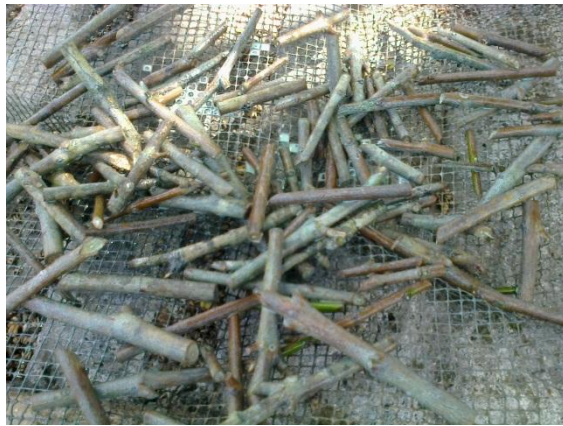
Fig.5: Escurrimiento de varetas