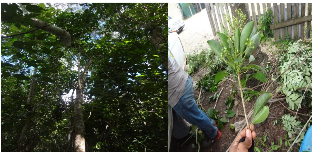
Fig.1: Identificación de especie sac-chaca ( dendropanaxarboreus )

4.2.1 Localización de sitios de colecta y selección de planta madre. Las varetas se colectaron en los ejidos de Hua-pix , San Román y jardín botánico del ITZM, que se ubican en la zona sur de Quintana Roo. Donde se colectaron de arboles madre juveniles, ya que se consideran que tienen mayor capacidad de división celular y se obtuvieron de zonas meristemáticas; para esto se tomo en cuenta el estado de sanidad de las plantas (libre de plagas y enfermedades).