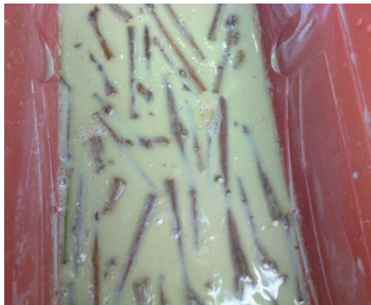
Fig.3: Desinfectación de varetas

Desinfección de las estacas. Se sumergieron en un recipiente con la solución de Cupravit® al 0.3% por un periodo de 10 minutos, para luego colocarlos en una malla tendida para que escurran y sequen por 5 minutos. Antes de establecer las estacas en el medio propagador (charolas), se aplicó la solución del regulador de crecimiento vegetal Rooting® , mediante el método de inmersión rápida que, consiste en introducir la base de la estaca en la solución concentrada por tres segundos e insertar inmediatamente la estaca en el medio de propagación. La siembra de las estacas se realizó con mucho cuidado, haciendo hoyos de 2 cm de profundidad, apoyando con un punzón señalado a la altura requerida, colocando la estaquilla en hoyo y presionando con los dedos alrededor de la estaca, con el objetivo de darle estabilidad con el sustrato. No se introdujo la estaca a presión dentro del sustrato por que puede dañar los delicados tejidos en el corte. La distribución se realizó de acuerdo a los tratamientos. La instalación del ensayo, será en la mañana y el invernadero se protegió previamente con mallasombra al 80%.