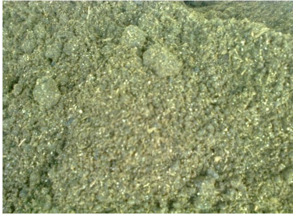
Fig.4: Combinación de suelo y petemos (50%-50%)