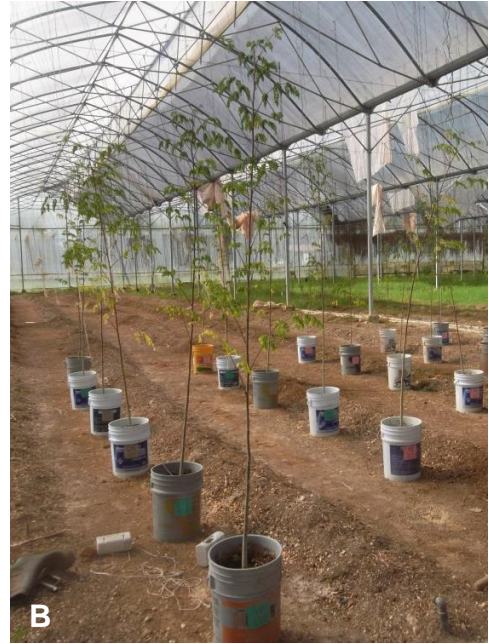
Figura 5. Comparación de plantas. A. Planta con microorganismos y 100% de humedad. B. planta sin microorganismos y 100% de humedad.