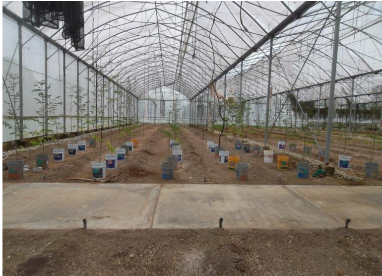
Figura 3. Diseño del experimento.