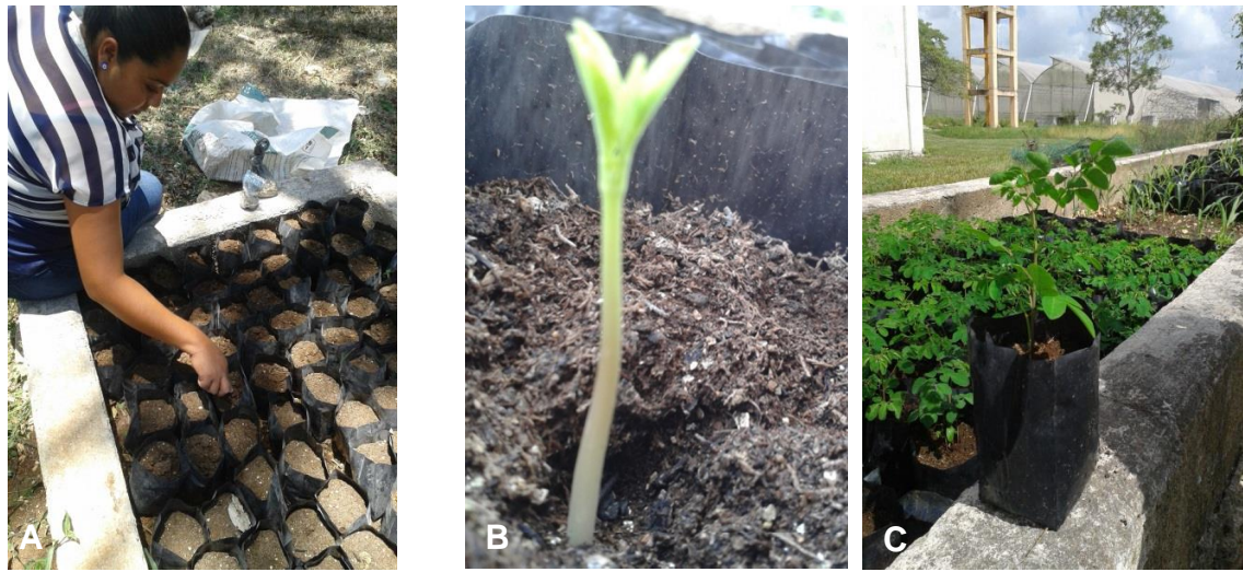
Figura 2. Producción de plántulas de M. oleífera ; A) siembra de semillas. B) germinación de semillas, C) plántulas.