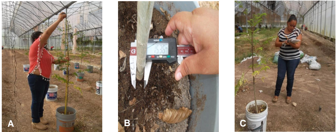
Figura 4. Toma de datos. A. Altura (cm). B. Diámetro (mm). C. Número de hojas.