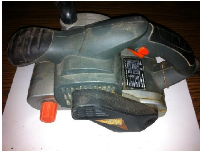
Fig. 3 Lijadora tipo banda

El lijado se realiza mediante una lijadora tipo banda, se lleva a cabo en dirección paralela al grano. La presión que se ejerce en el cojín opresor sobre la lija debe ser constante y uniforme. Los defectos que se presentan en el lijado son los rayones y el grano apelmusado; los rayones se presentan con mayor severidad en maderas con textura fina y alta densidad que en maderas de textura gruesa; el grano apelmusado es mayor en maderas blandas.