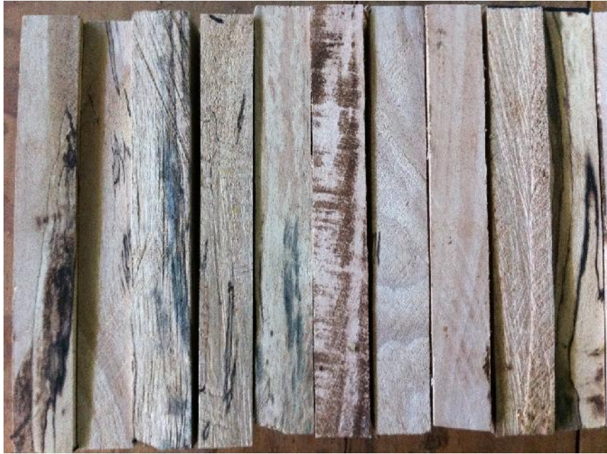
Fig. 4 Probetas de ensayo