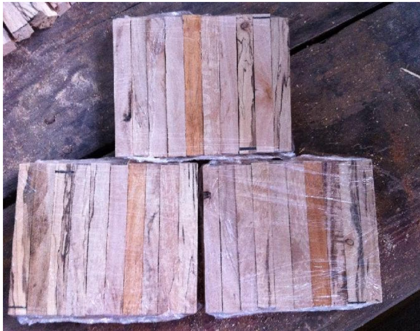
Fig. 5 probetas envueltas en papel plástico antiadherente film, para protegerlas de la humedad.