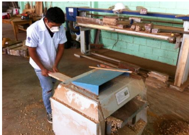
Fig. 2 Proceso de Cepillado

El cepillado es el corte periférico realizado mediante cuchillas con la maquina cepillo sobre la superficie de ambas caras de las tablas para obtener el espesor deseado uniforme y una superficie tersa y lisa. Es después del aserrío, la primera y más importante operación de maquinado, ya que cualquier pieza antes de ser utilizada en la elaboración de un producto final debe ser cepillada para darle valor agregado. Las maderas duras se cepillan mejor a favor del hilo y utilizando un ángulo de corte de cuchilla igual o menor a 20^\circ ; en maderas blandas el mejor cepillado se obtiene cuando el ángulo es de 20^\circ ó 30^\circ . Para reducir el ángulo de corte se hace un bisel en las cuchillas, ya que los cepillos comerciales están diseñados de tal forma que el ángulo de las ranuras del cabezal portacuchillas, dan un ángulo de corte de cuchilla de 30^\circ . La acción de las cuchillas debidamente alineadas se puede distribuir sobre la pieza de madera, haciendo variar la velocidad de alimentación o bien el número de rpm o velocidad de giro del cabezal portacuchillas, dando un determinado número de marcas de cuchilla (NMC) por centímetro sobre la superficie cepillada; así, un aumento en el NMC por centímetro mejora la calidad de cepillado.