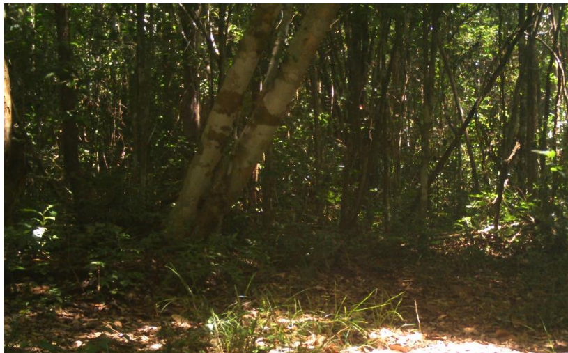
Ilustración 4: árbol seleccionado para la actividad de marqueo y toma de datos.

Se seguimiento al itinerario del taller se llevaron a los participantes a los lugares donde estratégicamente se han asignado cámaras trampas y conocieran las funciones e importancia de estas.