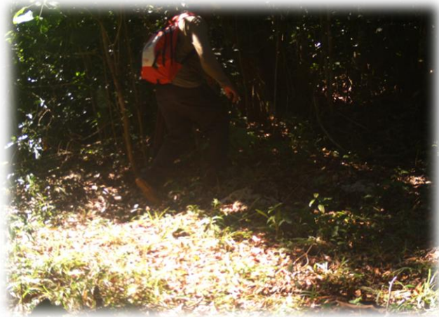
Ilustración 3: ejidatario participando en la actividad de uso del GPS.

La actividad denominada “marqueo y toma de datos” se les proporciono a los participantes unas hojas con coordenadas en donde se encontraban los arboles designados en esta actividad, se midieron árboles con un diámetro arriba de 35 cm de DM para maderas tropicales y arriba de 55 cm de diámetro para cedro y caoba.