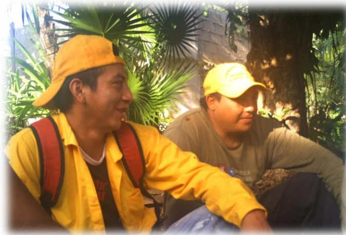
Ilustración 2: ejidatarios llegando al huasteco.

En el segundo día del taller la primera actividad fue la transportación de los participantes al huasteco, en ese lugar se tomó un tiempo designado para el desayuno.